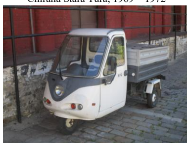
Nákladná trojkolka LIAZ 3VeKa, Liaz Veľký Krtíš, 1997