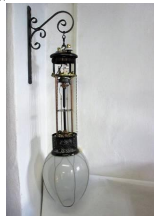
Lampa závesná, nadobudnutá do zbierkového fondu STM v roku 1995

Zároveň kontinuálne pokračovalo etapovité reštaurovanie zbierkového predmetu zo zbierky Letectvo, vrtuľníka Mi-8PS. Realizované boli záverečné montážne práce na vnútornom interiéri pre cestujúcich, vykonala sa montáž okien, kompletovaní a montovali sa brzdy, stojiny hlavného a predného podvozku, plnili sa tlmiče podvozku. Bola vykonaná montáž dverí cestujúcich, chvostovej ostruhy, chýbajúci nástrek farebného poľa na chvostovej časti vyrovnávacieho rotora, ďalej celková montáž systému klimatizácie a vyhrievania.