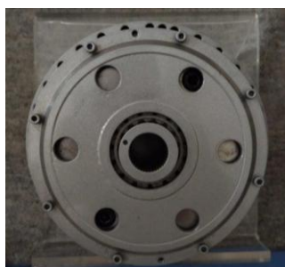
Ložiskový reduktor TS185-139, Spinea Prešov, súčasnosť