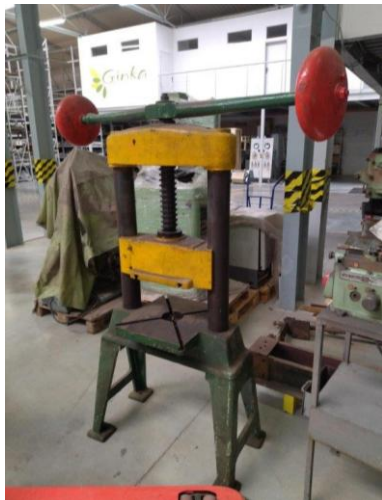
Lis vretenový, výrobca neznámy, 2. pol. 20. stor.

Ukážka rôznorodosti akvizícií odrážajúca dokumentačné zábery jednotlivých zbierok STM: