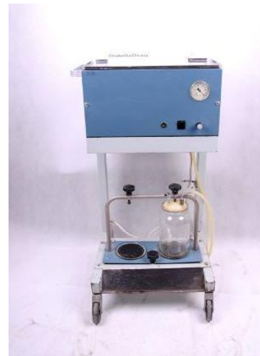
Odsávačka, Chirana Stará Turá, 60. r. 20. stor.