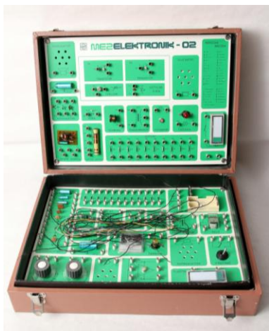
Polytech. stavebnica MEZ ELEKTRONIK - 02, ZSE Praha, MEZ Frenštát, 1987