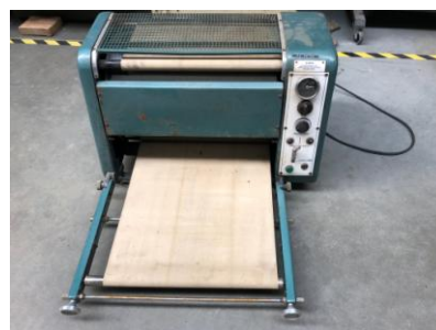
Bubnová leštička K 32, DĚLBA Praha, 1962