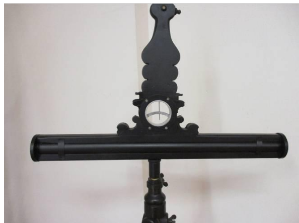
Výškomerný prístroj z roku 1750 (replika/ukážka vývoja nivelačných prístrojov), nadobudnutý do zbierkového fondu STM v roku 1959