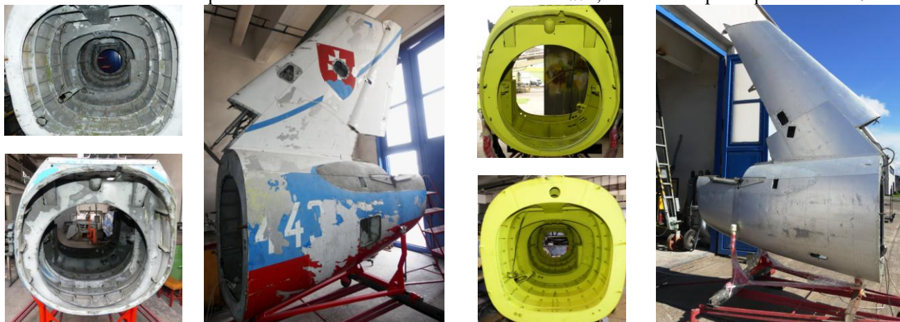
zľava zadná časť trupu a stav pred odstránením starého náteru, vpravo stav po odstránení starého náteru

Z reštaurovania Lietadla L-39 V, vypožičaného zo zbierkového fondu VHÚ-VHM Piešťany za účelom reštaurovania a následne prezentácie v STM-Múzeu letectva v Košiciach, realizované práce počas roka 2021: