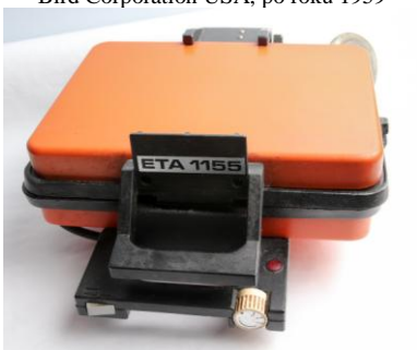
Elektrický kontaktný gril ETA 1155, Elektro-Praga Hlinsko, 80. r. 20. stor.