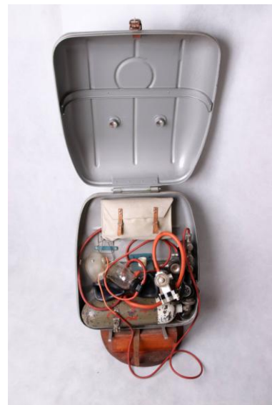
Kyslíkový dýchací prístroj KPT – D, Chirana Stará Turá, 1966