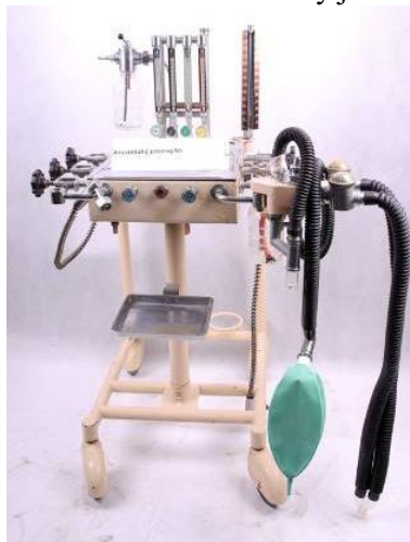
Anestetický prístroj N5, Chirana Stará Turá, 1969 – 1972