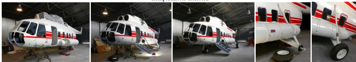
kompletná montáž podvozku