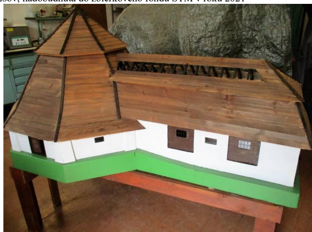
Model Gápfa v Solivare Prešov, nadobudnutý do zbierkového fondu STM v roku 1947