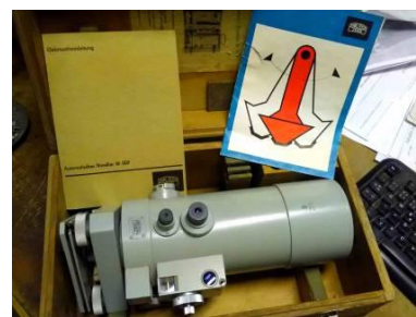
Nivelačný prístroj Ni 007 Zeiss, WEB Carl Zeiss Jena, 70. r. 20. stor.