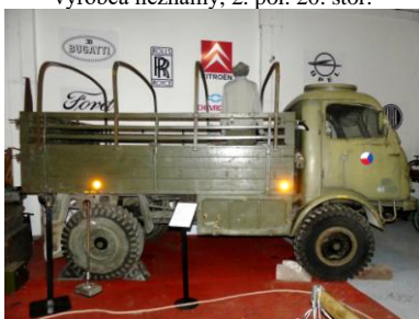
Nákladný automobil Tatra 805 valník, Tatra Kopřivnice, 1964