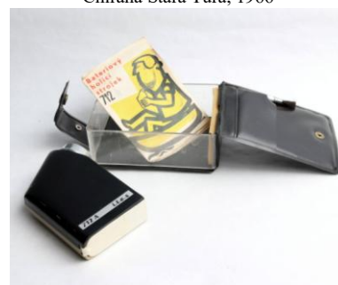
Batériový holiaci strojček 712 A - ites, KOH-I-NOR, Hardthmut České Budějovice, n. p., závod 09 Trhové Sviny, 60. r. 20. stor.