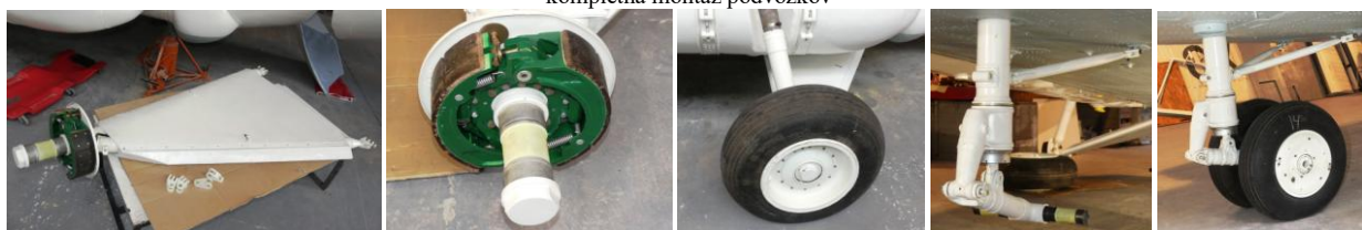
montáž brzd, kolies, kompletizácia stojiny hlavného podvozku

Popri komplexnom odbornom ošetrovaní zbierkových predmetov boli v hodnotenom období realizované ošetrenia a opravy prevádzkových ochranných krytov lietadiel Mig-21, kužele, ochranné sytá, krytky, zadné čečlá, ktoré prešli malou generálnou opravou.