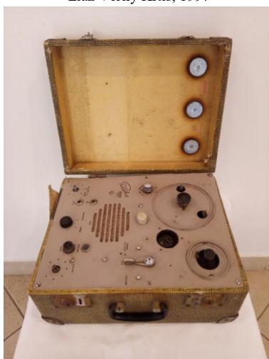
Drôtofon Paratus MEOPTA, Meopta Píerov, 1949