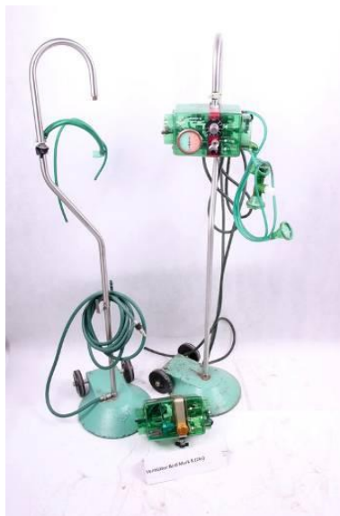
Ventilátor Bird Mark 8, Bird Corporation USA, po roku 1968