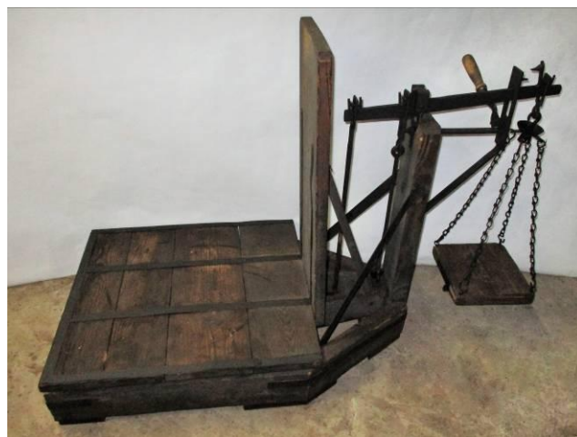
Obchodná váha na váženie soli v starom závode v Solivare Prešov, nadobudnutá do zbierkového fondu STM v roku 2021