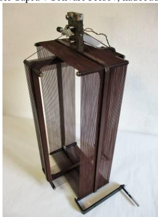
Rádioanténa, nadobudnutá do zbierkového fondu STM v roku 1956