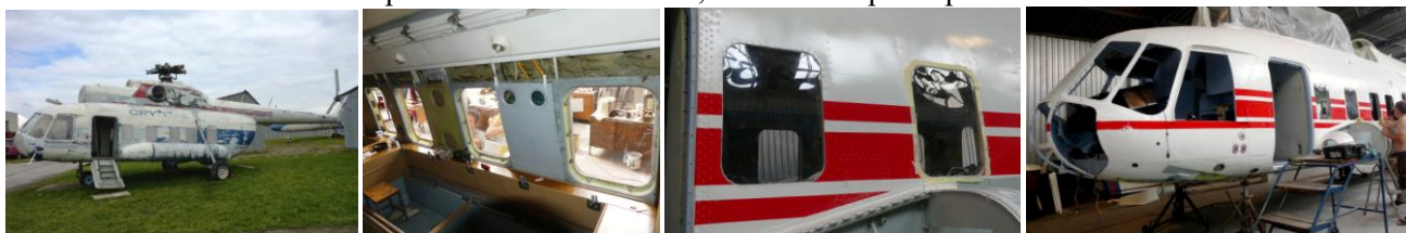
vľavo stav vrtuľníka pri nadobudnutí v roku 2016, v roku 2021 pokračujúce reštaurovanie – montáž okien

Z reštaurovania zbierkového predmetu Vrtuľník Mi-8, realizované práce počas roka 2021: