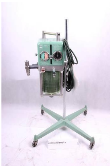
Ventilátor Bird Mark 4, Bird Corporation USA, po roku 1959