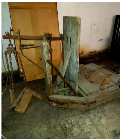
Obchodné váhy veľké, používané v starom závode Solivare Prešov, 20. stor.