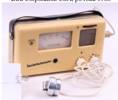
Kardiotachometer, Chirana Stará Turá, 2. pol. 20. stor.